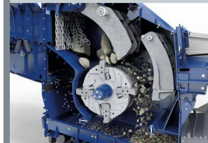
Frantoio con geometria d'ingresso ottimizzata