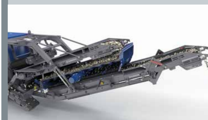
Vaglio vibrante con elevata superficie di vagliatura