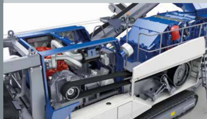
Azionamento diretto del frantoio tramite giunto idraulico