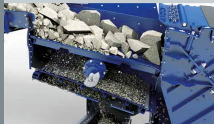
Prevaglio indipendente a due piani