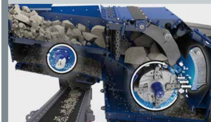
Continuous Feed System (CFS)