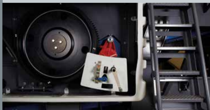
Sistema di sicurezza Lock &amp; Turn