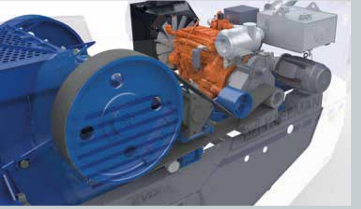
Accionamiento directo mediante acoplamiento hidráulico