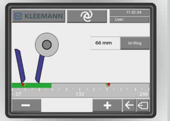
Ajuste de la machacadora desde el menú táctil