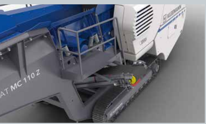
Cinta lateral corta