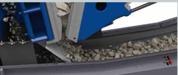
Placa de protección y amplia zona de descarga