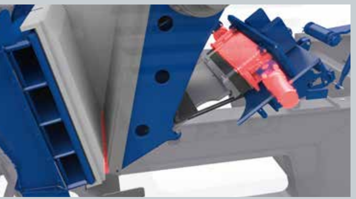
Sistema hidráulico de ajuste