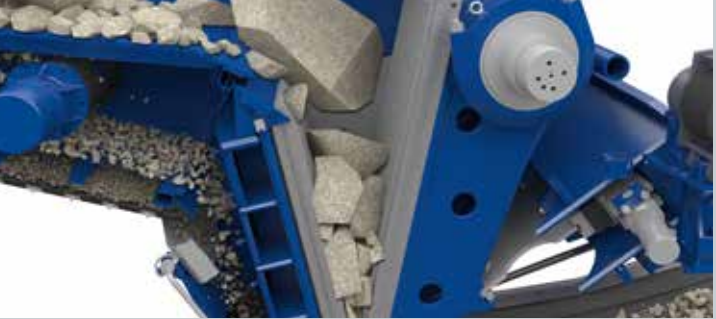
Sistema de funcionamiento de la machacadora constante