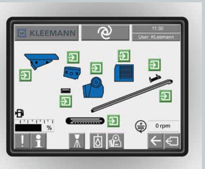
Sistema de arranque mediante control