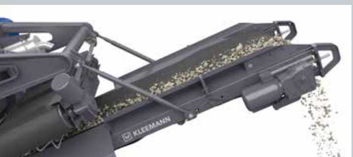
Cinta principal de descarga

+ El innovador sistema de accionamiento directo de la machacadora y los accionamientos eléctricos de componentes, como la precriba, motores de vibración y cintas, permite tener enormes reservas de potencia junto a unos valores de consumo óptimos al mismo tiempo.