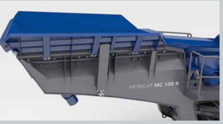
Opcional de extensión de tolvas