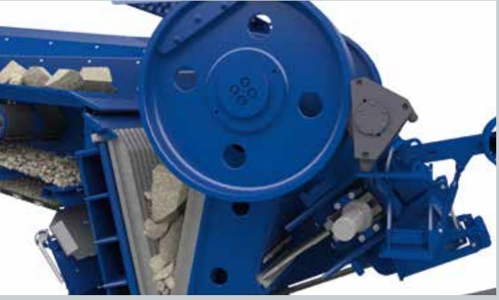
Sistema de desbloqueo de la machacadora