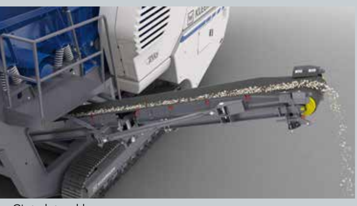
Cinta lateral larga