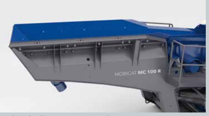
Tolvas de alimentación integradas